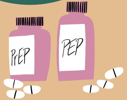
◆ PrEP = PrEP = ยาป้องกันการติดเชื้อเอชไอวีก่อนการสัมผัสโรค