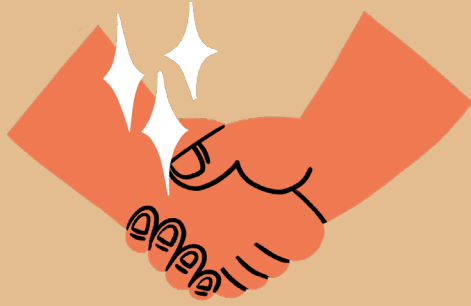
◆ การจับมือทักทาย