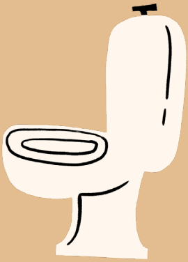
◆ พื้นผิวต่าง ๆ