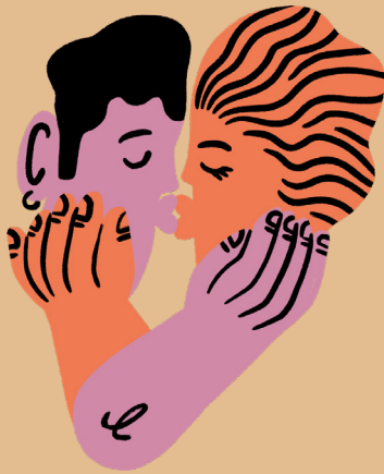
التقبيل، ملامسة الجلد